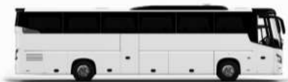
ตัวอย่างรถทัวร์ 1 คัน

ค่าที่พักตามที่ระบุในรายการหรือเทียบเท่าระดับเดียวกัน (ห้องพักละ 2 ท่าน) หากประเภทห้องที่ท่านริเวสมาเดิม อาทิ เช่น ริเวสห้องพักเป็น TWIN BED หรือ DOUBLE BED ทางบริษัทของสงวนสิทธิ์ในการปรับประเภทห้องพัก เป็น ตามที่โรงแรมมีอยู่ โดยไม่ต้องแจ้งให้ทราบล่วงหน้า