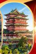
หอถึงหวังเก้อ