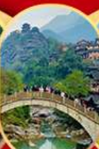
หวังเซียนกุ