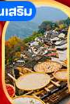
หมู่บ้านหวงหลง