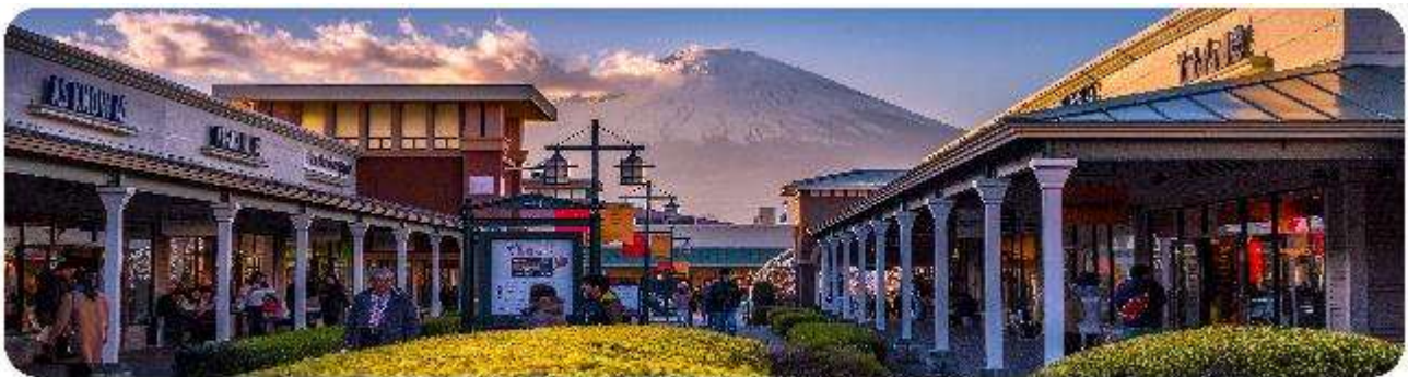
GOTEMBA PREMIUM OUTLETS

เมืองเล็กๆ ที่ตั้งอยู่ทางตอนใต้ของจังหวัดคานากาวะ ห่างจากโตเกียวเพียงแค่ 1 ชั่วโมง เท่านั้น แต่เต็มไปด้วยสถานที่ท่องเที่ยว ทิวทัศน์ธรรมชาติ และชายหาดที่งดงาม ที่นี้จะทำให้ทุกคนรู้สึกเหมือนได้ย้อนกลับไปสัมผัสประวัติศาสตร์ญี่ปุ่นในยุคซามูไร พร้อมทั้งได้ผ่อนคลายท่ามกลางบรรยากาศที่เงียบสงบและสดชื่น จุดเด่นแห่งเมืองนี้คือ พระพุทธรูปองค์ใหญ่ไดบุตสึ (Daibutsu) หนึ่งในสัญลักษณ์ที่โดดเด่นที่สุดของ Kamakura พระพุทธรูปปรภอนซ์ขนาดมหึมาที่วัดโคโตคุอิน (Kotoku-in) ที่มีความสูง 13.35 เมตร หนึ่งในพระพุทธรูปที่ใหญ่ที่สุดในญี่ปุ่น ไฮไลท์ของที่นี่คือการได้ชมความงดงามที่ตัดกันระหว่างพระพุทธรูปไดบุตสึขนาดใหญ่และต้นซากุระ ซึ่งปลูกอยู่ทั้งด้านหน้าและด้านหลังของพระพุทธรูป ทำให้เหมาะอย่างยิ่งกับการเดินเล่นและชมซากุระในบริเวณวัด เป็นอีกหนึ่งสถานที่ที่ต้องมาเยือนสักครั้ง หนึ่งในจุดไฮไลท์ของเมืองคามาคูระคือ ไม้ไผ่กลั่นพาเยื่อน เกาะเอโนชิมะ (Enoshima) เป็นเกาะที่ตั้งอยู่ในจังหวัดคานากาวะ ประเทศญี่ปุ่น ซึ่งเป็นจุดหมายท่องเที่ยวยอดนิยมที่มีทิวทัศน์สวยงามและสถานที่ที่น่าสนใจมากมาย ทั้งชายหาดสวย และวิวทะเลที่งดงาม ในวันที่ท้องฟ้าโปร่งใสเรายังสามารถมองเห็นวิวของภูเขาไฟฟูจิได้อีกด้วย ด้านบนยังมี ศาลเจ้าเอโนชิมะ ที่มีความสำคัญในด้านความโชคดี โดยเฉพาะในเรื่องความรัก นอกจากนี้ยังมี หอคอยประภาคารเอโนชิมะ ที่ให้ทัศนียภาพ 360 องศา ของเมืองคามาคูระได้อีกด้วย