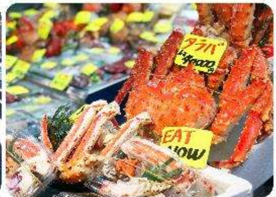
ตลาดปลาซึกิจิ

แนะนำที่เกี่ยวข้อง อิสระด้วยตัวเอง - ตลาดปลาซึกิจิ Tsukiji Outer Market ตลาดปลาที่มีชื่อเสียงของญี่ปุ่น และยังเป็นหนึ่งในตลาดปลาที่ใหญ่ที่สุดในโลกด้วยตะ ตั้งอยู่ในโตเกียว ตลาดแห่งนี้มีการซื้อขายอาหารทะเลมากกว่า 2,000 ตันต่อวัน โดยโซนภายในตลาดนั้นจะแบ่งออกเป็น 2 ส่วน ก็คือ ส่วนด้านนอก ที่มีร้านค้าปลีกและร้านอาหารอยู่เรียงรายให้เราได้เลือกซื้ออาหารทะเลสดๆ รับประทานกัน