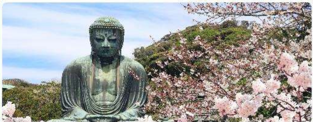
พระใหญ่โตบุทสึ วัดโคโตะคุอิน