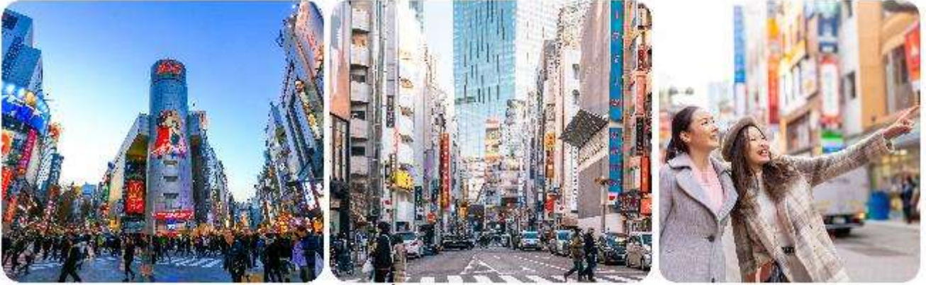
ช้อปปิ้งใจกลางกรุงโตเกียว