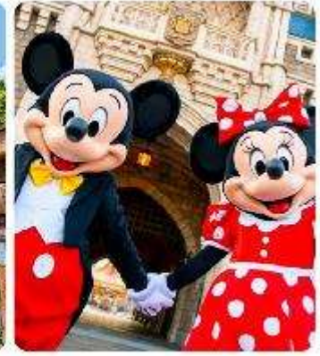
โตเกียวดิสนีย์แลนด์

แนะนำที่เที่ยว อิสระด้วยตัวเองเต็มวัน ! เลือกซื้อทัวร์เสริมอิสระดิสนีย์แลนด์ (ไม่มีหัวหน้าทัวร์และไม่มีไกด์นำเที่ยว) เอาใจแฟนพันธุ์แท้ของดิสนีย์ กับ สวนสนุกโตเกียวดิสนีย์แลนด์ ที่เต็มไปด้วยการผจญภัย ความสนุกสนานในโลกแฟนตาซีเมื่อเดินทางเข้าสู่ สวนสนุกโตเกียวดิสนีย์แลนด์ จะพบกับธีมพาร์คที่ แบ่งออกเป็น หลากหลาย เช่น Adventureland ที่เต็มไปด้วยการผจญภัยในป่าและน้ำตก, Fantasyland ดินแดนของตัวละครดิสนีย์ที่คุณหลงใหล, และ Tomorrowland ที่จะพาคุณไปสำรวจอนาคตที่เต็มไปด้วยนวัตกรรม และเปิดประสบการณ์ใหม่ที่ Tokyo Disney Sea ที่จะพาคุณไปผจญภัยยังโลกทะเลและการผจญภัยทางน้ำ นอกจากนี้เรายังเพลิดเพลินกับร้านอาหารและคาเฟ่รวมไปถึงของฝากจากดิสนีย์อีกมาย (ค่าทัวร์ยังไม่รวมบัตรค่าเข้า)