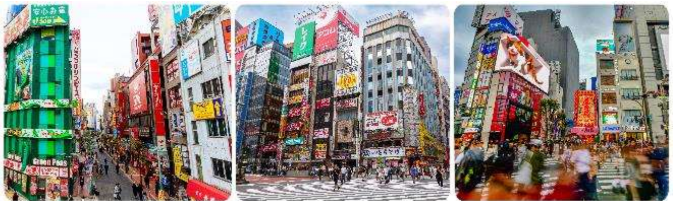
ช้อปปิ้งใจกลางกรุงโตเกียว - ชินจูกุ

มือกลางวัน บริการท่านด้วย ชุดอาหารญี่ปุ่นเบนโตะ