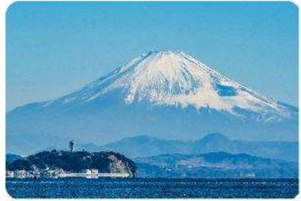
เกาะเอโนชิมะ

เมืองเล็กๆ ที่ตั้งอยู่ทางตอนใต้ของจังหวัดคานากาวะ ห่างจากโตเกียวเพียงแค่ 1 ชั่วโมง เท่านั้น แต่เต็มไปด้วยสถานที่ท่องเที่ยว ทิวทัศน์ธรรมชาติ และชายหาดที่งดงาม ที่นี้จะทำให้ทุกคนรู้สึกเหมือนได้ย้อนกลับไปสัมผัสประวัติศาสตร์ญี่ปุ่นในยุคซามูไร พร้อมทั้งได้ผ่อนคลายท่ามกลางบรรยากาศที่เงียบสงบและสดชื่น จุดเด่นแห่งเมืองนี้คือ พระพุทธรูปองค์ใหญ่ไดบุตสึ (Daibutsu) หนึ่งในสัญลักษณ์ที่โดดเด่นที่สุดของ Kamakura พระพุทธรูปปรภอนซ์ขนาดมหึมาที่วัดโคโตคุอิน (Kotoku-in) ที่มีความสูง 13.35 เมตร หนึ่งในพระพุทธรูปที่ใหญ่ที่สุดในญี่ปุ่น ไฮไลท์ของที่นี่คือการได้ชมความงดงามที่ตัดกันระหว่างพระพุทธรูปไดบุตสึขนาดใหญ่และต้นซากุระ ซึ่งปลูกอยู่ทั้งด้านหน้าและด้านหลังของพระพุทธรูป ทำให้เหมาะอย่างยิ่งกับการเดินเล่นและชมซากุระในบริเวณวัด เป็นอีกหนึ่งสถานที่ที่ต้องมาเยือนสักครั้ง หนึ่งในจุดไฮไลท์ของเมืองคามาคูระคือ ไม้ไผ่กลั่นพาเยื่อน เกาะเอโนชิมะ (Enoshima) เป็นเกาะที่ตั้งอยู่ในจังหวัดคานากาวะ ประเทศญี่ปุ่น ซึ่งเป็นจุดหมายท่องเที่ยวยอดนิยมที่มีทิวทัศน์สวยงามและสถานที่ที่น่าสนใจมากมาย ทั้งชายหาดสวย และวิวทะเลที่งดงาม ในวันที่ท้องฟ้าโปร่งใสเรายังสามารถมองเห็นวิวของภูเขาไฟฟูจิได้อีกด้วย ด้านบนยังมี ศาลเจ้าเอโนชิมะ ที่มีความสำคัญในด้านความโชคดี โดยเฉพาะในเรื่องความรัก นอกจากนี้ยังมี หอคอยประภาคารเอโนชิมะ ที่ให้ทัศนียภาพ 360 องศา ของเมืองคามาคูระได้อีกด้วย