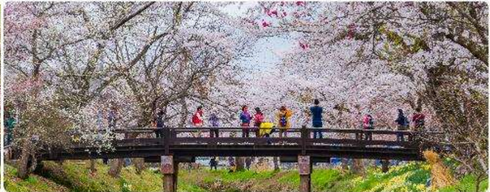
หมู่บ้านน้ำใสโอชิโนะ อักโก

โอชิโนะ อักโก หรือ ที่รู้จักกันในชื่อ หมู่บ้านน้ำใส ความงามแห่งธรรมชาติและวัฒนธรรมที่ ซ่อนอยู่ใต้เงากุเขาไฟฟูจิโอชิโนะ อักโก ตั้งอยู่ในหมู่บ้านโอชิโนะ จังหวัดยามานาชิ ประเทศญี่ปุ่น เป็นแหล่งนำธรรมชาติที่มีชื่อเสียง ประกอบด้วยบ่อน้ำใสสะอาดทั้งแปดแห่ง ซึ่งน้ำในบ่อเหล่านี้เกิด