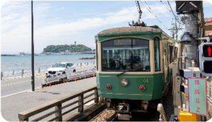
เมืองคามาคูระ

เมืองคามาคูระ (Kamakura) เมืองน่ารักติดทะเล ตอบโจทย์ที่เกี่ยวกับที่ผสมผสานระหว่างประวัติศาสตร์ ธรรมชาติ และความงามของทะเล บอกเลยใครมาต้องตกหลุมรักกับเมืองสุดชิล อย่าง คามาคูระ