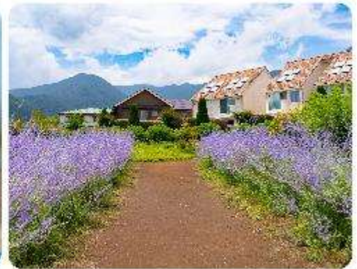
สวนโออิชิ ปาร์ค

สวนดอกไม้โออิชิ พาร์ค (Oishi Park) มหัตศจรรย์แห่งวิวกุเขาไฟฟูจิ หนึ่งในจุดชมวิวกของ กุเขาไฟฟูจิที่สวยงามที่สุดอีกจุดหนึ่ง ที่จะเติมเต็มความสงบและความงดงามของธรรมชาติในญี่ปุ่นเมื่อ ไปเยือน คือสถานที่ที่ไม่ควรพลาด สวนดอกไม้โออิชิ พาร์ค (Oishi Park) แห่งนี้ไม่ได้เป็นเพียง สถานที่ที่มีดอกไม้สวยงามให้เราชื่นชมแล้ว จุดเด่นของสวนนี้คือวิวกุเขาฟูจิที่อยู่เบื้องหลังสวน ดอกไม้สีแสนสดใส ที่บานสะพรั่งในทุกฤดูกาล และยังเป็นมุมที่ให้เราสัมผัสกับวิวกุเขาฟูจิได้อย่าง ใกล้ชิด จากนั้นนำพาทุกท่านสู่..