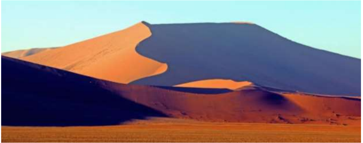
แรงจนถึงปัจจุบัน

6/48 ซอยลาดพร้าว 101 แขวง 42 ซึ่ง ณ บริเวณนี้เคยเป็นสถานที่กักเก็บน้ำมาก่อน ทำให้มีต้นไม้ จาพวก Acacia ขึ้นเป็นจำนวนมาก แต่ปัจจุบันนี้ น้ำได้หายไปหมดแล้ว ทำให้ต้นไม้ตาย ยืนต้นตาย สถานที่แห่งนี้เลยไม่มีต้นไม้ขึ้น กลายเป็นสถานที่แห่ง