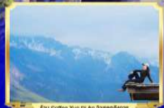
Enu coffee Yun Di An 5sqm54m