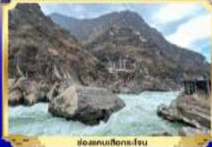
โคมไฟโบราณ-โถ