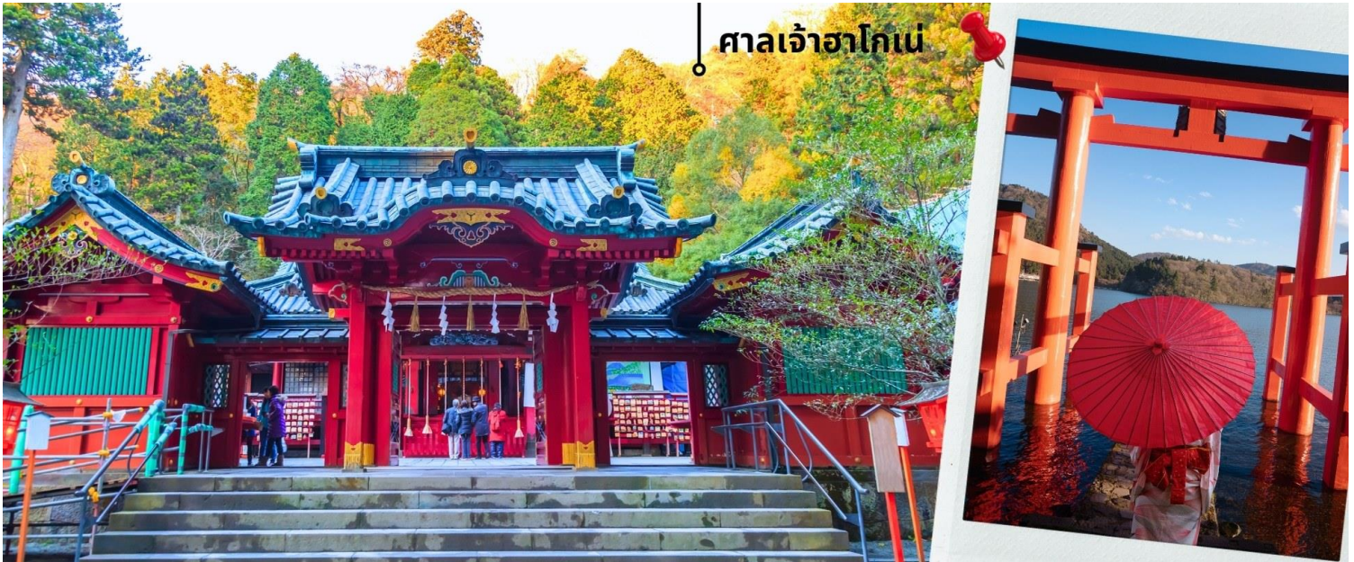
ศาลเจ้าฮาโกเน่

เพื่อเดินทางไหว้ขอพรกันต่อที่ ศาลเจ้าฮาโกเน่ Hakone Shrine ก่อตั้งขึ้นในปี ค.ศ. 757 ในรัชสมัยของจักรพรรดิโคโช เป็นหนึ่งในศาลเจ้าที่ในอดีตเหล่าขุนพลแคว้นมาที่นี้เพื่อมาสวดภาวนา เนื่องจากมีความเชื่อว่าศาลเจ้าแห่งนี้จะนำโชคมาสู่ในเรื่องของการต่อสู้ ทำให้ศาลเจ้าแห่งนี้มีชื่อเสียงโด่งดังไปทั่วประเทศ และยังได้รับการขึ้นทะเบียนในปี ค.ศ. 1875 ให้เป็นศาลเจ้าลำดับที่ 3 ในบรรดาศาลเจ้าแห่งชาติของญี่ปุ่น ปัจจุบันนี้ผู้คนนิยมมาสักการะขอพรในเรื่องของการเดินทางให้แคล้วคลาด รวมไปถึงเรื่องการคลอดบุตรให้ปลอดภัย