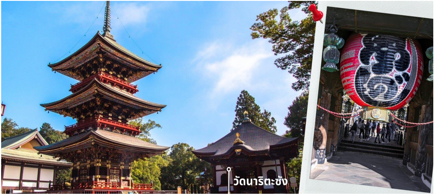
วัดนาริตะซัง

จากนั้นนำท่านเดินทางไปยัง AEON MALL ภายในตัวห้างมีร้านค้าต่างๆมากถึง 150 ร้านซึ่งตกแต่งในรูปแบบที่ทันสมัย สไตล์ญี่ปุ่นสินค้ามากมายหลากหลายให้เลือกตั้งแต่เสื้อผ้าแฟชั่นอาหารสดใหม่และอุปกรณ์ภายในบ้านรวมถึง เครื่องสำอางค์ขนมญี่ปุ่นต่างๆและยังมีร้านค้ามากมายไม่ว่าจะเป็น Muji, 100 yen shop, Sanrio store, Capcom games arcade และก็ยังมีซูเปอร์มาร์เก็ตขนาดใหญ่ให้ท่านได้เลือกซื้อของ