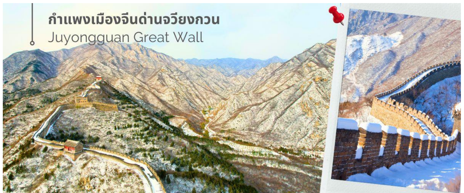
กำแพงเมืองจีนด่านจวิ๊ยกกวน Juyongguan Great Wall

แวะชมสินค้าร้านบัวหิมะ (ร้านรัฐบาลจีน) จากนั้นนำท่านเดินทางชมความยิ่งใหญ่ของ กำแพงเมืองจีนด่านจวิ๊ยกกวน (Juyongguan Great Wall) หรือที่รู้จักกันในชื่อ ป้อมจวิ๊หยง เป็นด่านที่ใกล้กับใจกลางกรุงปักกิ่งมากที่สุด ราว 50 กิโลเมตร เท่านั้น นับเป็นหนึ่งในด่านสำคัญและเป็นสัญลักษณ์ของกำแพงเมืองจีน มีความยาวราว 4 กิโลเมตร ตั้งอยู่ทางทิศตะวันตกเฉียงเหนือของกรุงปักกิ่ง สร้างขึ้นในสมัย จีนชิงฮ่องเต้ กำแพงนี้ตั้งอยู่ในหุบเขา Guangou ทำให้มีชื่อได้เปรียบโดยธรรมชาติคือสามารถ "ยึดครองได้ง่าย แต่โจมตีได้ยาก" ถือว่าเป็นหนึ่งในจุดเริ่มต้นของกำแพงเมืองจีนในภาคเหนือ ซึ่งสร้างขึ้นเพื่อป้องกันกรุงปักกิ่งจากรุกรานจากชนเผ่าเร่ร่อน ด่านจวิ๊หยกกวนมีสถาปัตยกรรมที่สวยงามของศิลปะจีน จากยอดด่าน สามารถมองเห็นทิวทัศน์ที่สวยงามของเทือกเขาและธรรมชาติโดยรอบ นับว่า