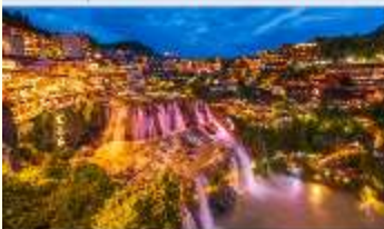
ฟูหรงเจิน