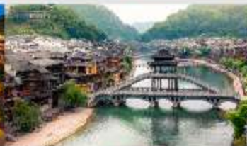
เฟิ่งหวง