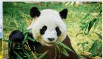
สวนหมีแพนด้า

*ทางบริษัทฯ ขอสงวนสิทธิ์ในกรณีการเปลี่ยนแปลงโปรแกรมทัวร์ตามความเหมาะสมขึ้นอยู่กับสถานการณ์หน้างาน โดยคำตงถึงผลประโยชน์ของลูกค้าเป็นสำคัญ