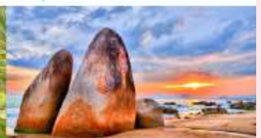
วนอุทยานสุดขอบฟ้า