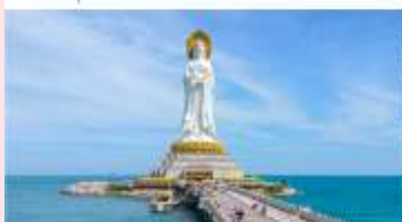
เจ้าแม่กวนอิมหนานซาน