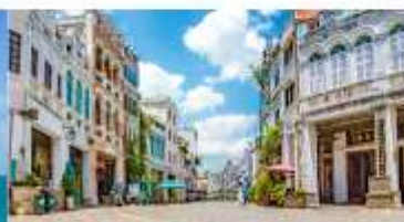
ถนนโบราณฉีไหลว