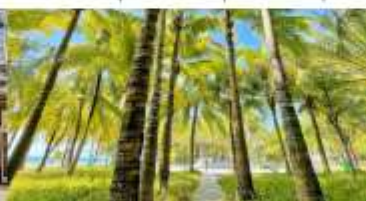
ทางเดินมะพร้าว