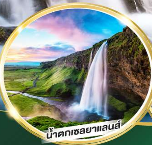
น้ำตกเซลยาแลนส์