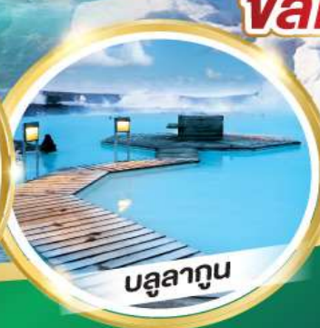
บรูลาทูน