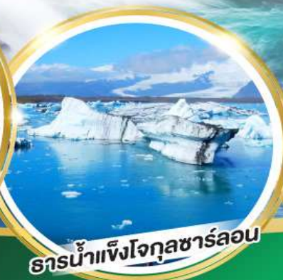
ธารน้ำแข็งโจกุลชาร์ลอน