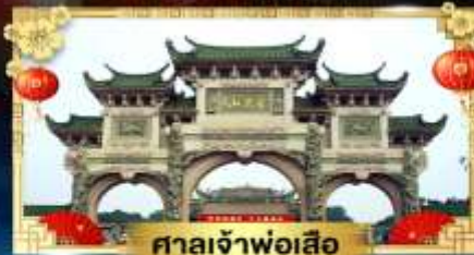
ศาลเจ้าพ่อเสือ