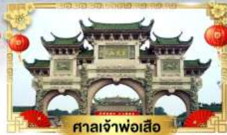
ศาลเจ้าพ่อเสือ