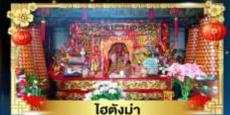
ไต้ต่งม่า