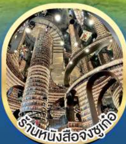
ร้านหนังสือจางซูเก๋