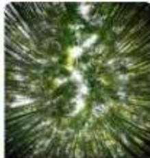
อาราชิยามะ