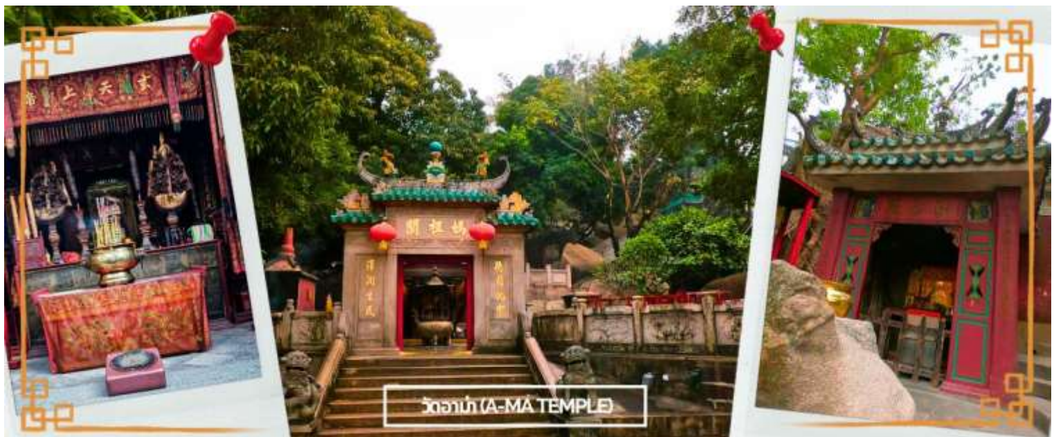
วัดอาม่า (A-MA TEMPLE)

จากนั้นนำท่านสู่ วัดอาม่า (A MA TEMPLE) หนึ่งในวัดสำคัญ ศักดิ์สิทธิ์ และเก่าแก่ที่สุดของมาเก๊า คนไทยคุ้นหูในชื่อศาลเจ้าแม่ทับทิม โด่งดังในการขอพรเรื่องหน้าที่การงาน การเงิน และความเป็นสิริมงคลแก่ชีวิต ใครที่ไปกราบไหว้ บูชา กลับมาชีวิตในการทำงาน การเงินก็จะดีขึ้น มีเทพศักดิ์สิทธิ์องค์ต่างๆ ซึ่งผสมผสานความเชื่อทางพุทธศาสนา ลัทธิเต๋า คติความ