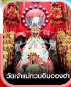
วัดเจ้าแม่กวนอิมสองฮ่า

✈️ คอนเฟิร์มออกเดินทาง ✈️ ทุกพีเรียด 2 ท่านขึ้นไป