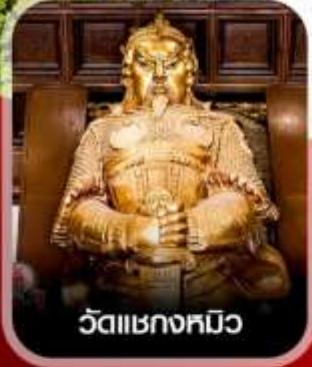
วัดเขกหมิว