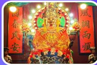
วัดเจ้าแม่กวนอิมเทียนหัว