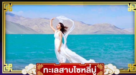
ทะเลสาบโซหลูมู