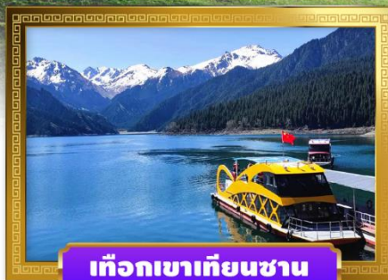
เทือกเขาเทียนชาน