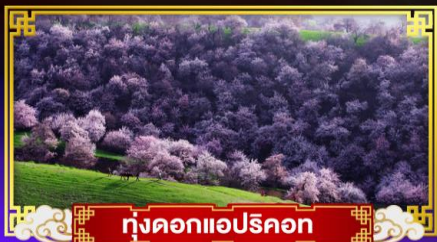
ทุ่งดอกแอปริคอต