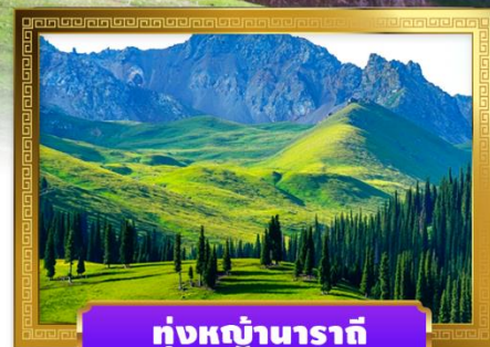
หุบหญ้านาราตี