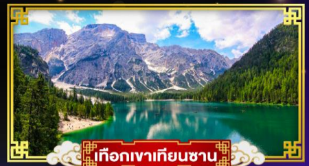
เทือกเขาเทียนชาน