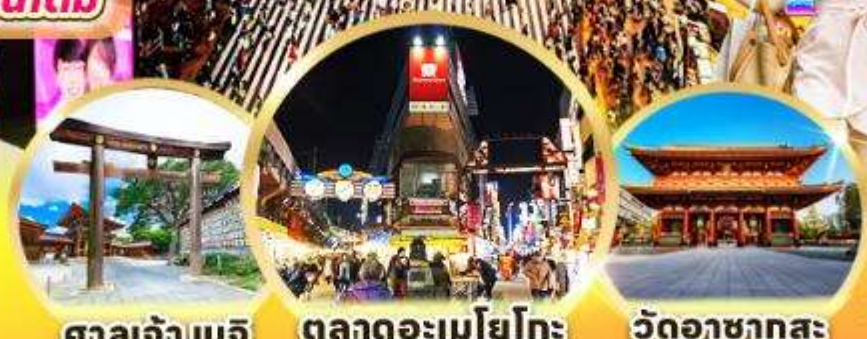
ศาลเจ้าเมจิ ตลาดอะเมโยโกะ วัดอาซากุสะ