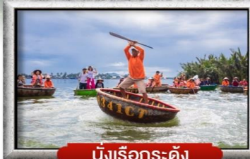
นั่งเรือกระดิง