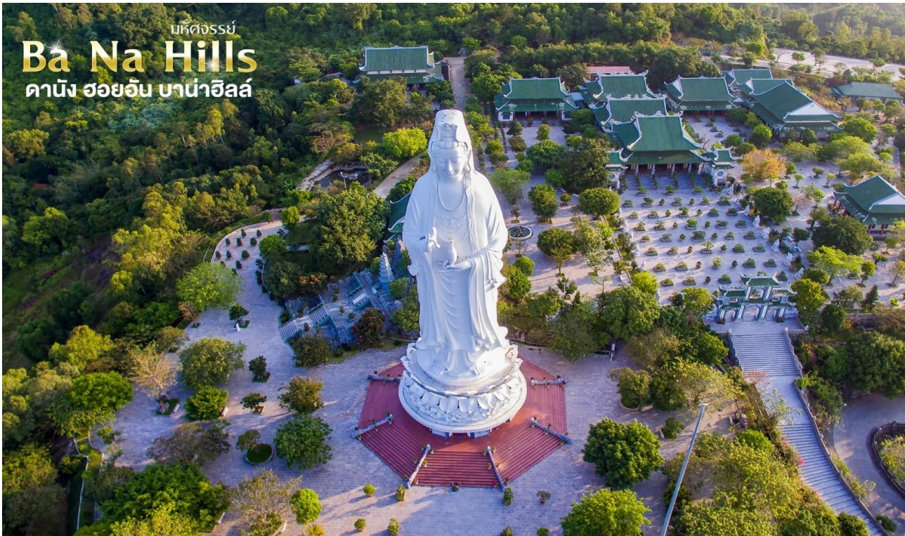
มัทฉะ Ba Na Hills ดานัง ฮอยอัน บาน่าฮิลล์

เป็นสถานที่ศักดิ์สิทธิ์ที่ชาวบ้านมากราบไหว้บูชาและขอพรแล้วยังเป็นอีกหนึ่งสถานที่ท่องเที่ยวที่สวยงามเป็นอีกหนึ่งจุดชมวิวที่สวยงามของเมือง ดานัง