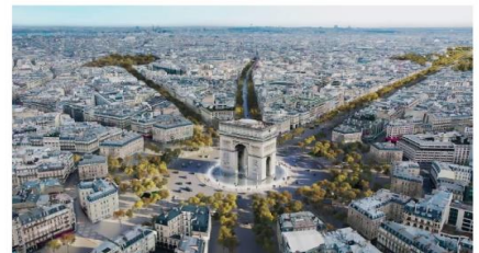
จัตุรัสแห่งดวงดาว