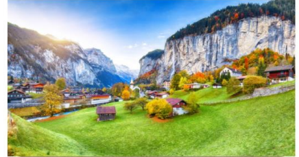
เลาเทอร์บรุนเนน