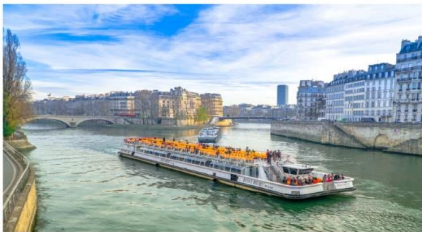
ล่องเรือบาโตมุซ