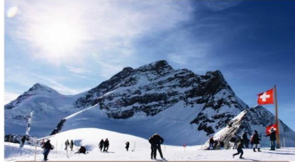
ยอดเขาจุงเฟรา