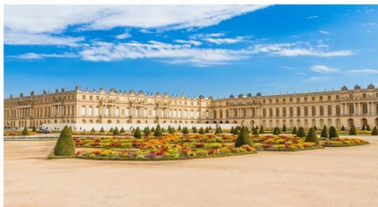
พระราชวังแวร์ซาย