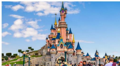
ดิสนีย์แลนด์ ปารีส