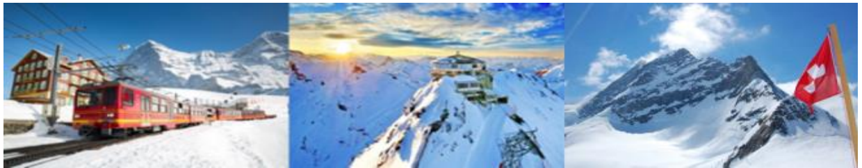
เที่ยง รับประทานอาหารกลางวันเมนูที่ดีที่สุด ณ ภัตตาคาร บนยอดเขาจุงเฟรา (มื้อที่ 9)

นำคณะออกเดินทางโดยรถไฟชั้ปรับอากาศมุ่งหน้าขึ้นสู่เมือง เลาเทอร์บรุนเนน เพื่อนำท่านขึ้นรถไฟ สายจุงเฟราบาทน์ ระหว่างการเดินทางท่านจะได้ชมวิวทิวทัศน์แบบสวิสเซอร์แลนด์ชันนานแท้ ที่มีทุ่งหญ้าอันเขียวชอุ่ม ดอกไม้ป่าบานสะพรั่งในฤดูใบไม้ผลิ หรือใบไม้เปลี่ยนสีในช่วงฤดูใบไม้ร่วง บ้านหลังน้อยใหญ่ปลูกแบบน่ารักๆทรงสวิสชาลด์ ฝูงวัวพื้นเมืองที่กระจัดกระจายแทะเล็มหญ้าอยู่ทั่วบริเวณ ถ้าธารน้ำธรรมชาติเล็กๆที่ใสสะอาดและฉากหลังที่มีภูเขาหิมะตั้งตระหง่านขาวโพลน ซึ่งจะทำให้ท่านได้รับความประทับใจเป็นอย่างยิ่ง นั่งรถไฟชมวิวทิวทัศน์ธรรมชาติบนภูเขาสูงแห่งแอลป์ แล้วเปลี่ยนเป็นรถไฟสายภูเขาที่สถานีไคลน์ไซเดิล รถไฟที่จะนำท่านเดินทางลอดอุโมงค์ที่ชาวสวิสฯได้ขุดเจาะไว้ที่ความสูงถึง 3,464 เมตร จนกระทั่งถึง สถานีรถไฟที่สูงที่สุดในยุโรป Top of Europe บนยอดเขาจุงเฟรา ซึ่งมีความสูง 4,158 เมตร (13,642 ฟุต) จุดสูงสุดคือลานน้ำแข็งขนาดใหญ่เรียกว่า Sphinx นักท่องเที่ยวหลายๆคนบอกว่าที่นี่สวยงามดุจดินแดนแห่งสวรรค์ เพราะยอดเขาแห่งนี้ปกคลุมด้วยหิมะขาวโพลนตลอดทั้งปี อากาศให้ท่านถ่ายภาพความประทับใจตามอัธยาศัยกับแบบจุใจ ไม่มีแรงรีบ จากนั้นนำท่าน ชม ถ้ำน้ำแข็ง 1,000 ปี ที่สร้างโดยการเจาะธารน้ำแข็งเข้าไปถึง 30 เมตร พร้อมชมน้ำแข็งแกะสลักรูปร่างต่าง จากนั้นชมวิวทิวทัศน์และสัมผัสหิมะที่ลานพลาโต Plateau และ ไม่ควรพลาดการส่งโปสการ์ดจากที่ทำการไปรษณีย์ที่สูงที่สุดในโลก พร้อมซื้อของที่ระลึกต่างๆตามอัธยาศัย นำท่านขึ้น สวิสฟิงซ์ หรืออาคารสังเกตการณ์ ที่ความสูง 3,571 เมตร/11,716 ฟิต ท่านสามารถชมวิวได้รอบ 360 องศาจากระเบียงได้ประสบการณ์แสนประทับใจ เดินทางสู่ ยุงค์ ฟราวยอร์ค-หลังคายุโรป ไปแล้วไม่ได้มาจุดชมวิวจุดนี้เหมือนมาไม่ถึง