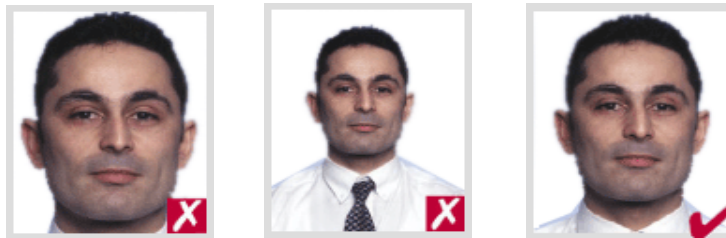
ไกลเกินไป