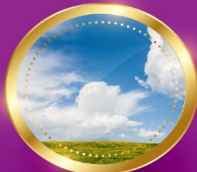
SPRING มีนาคม-พฤษภาคม