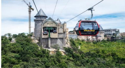
ขึ้นกระเช้าลอยฟ้า