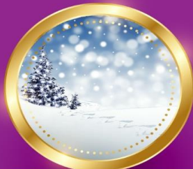
WINTER ธันวาคม-กุมภาพันธ์