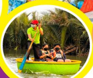
นั่งเรือกระดิง