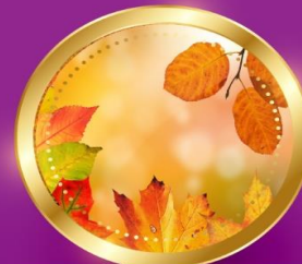
AUTUMN กันยายน-พฤศจิกายน