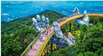
สะพานลอยฟ้า Golden Bridge