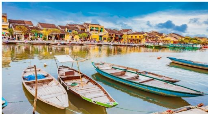
ฮอยอัน เมืองมรดกโลก