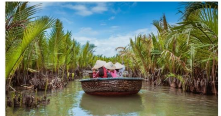
นั่งเรือกระด้ง