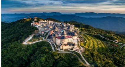
หมู่บ้านฝรั่งเศส