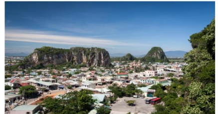
หมู่บ้านแกะสลักหินอ่อน