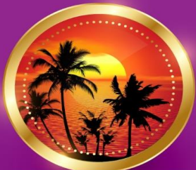
SUMMER มิถุนายน-สิงหาคม