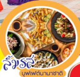
บุฟเฟ่ต์นานาชาติ