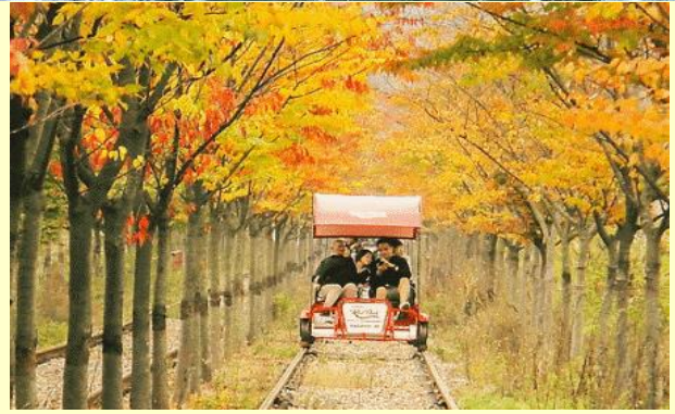
นำทุกท่านสัมผัสธรรมชาติและเปิดประสบการณ์

เที่ยง! บริการอาหารกลางวัน เมนูทักคาบิหรือไก่บาร์บีคิว ผัดซอสเกาหลี (อาหารเลี้ยงชื้อโดยการนำไก่บาร์บีคิว มันหวาน กะหล่ำปลี ต้นกระเทียม ซอส และข้าว มาผัดรวมกันบนกระทะแบบเสิร์ฟลูกเสิร์ฟทุกอย่างให้เข้าที่ รับประทานคู่กับผักกาดเกาหลี และเครื่องเคียงต่างๆ)