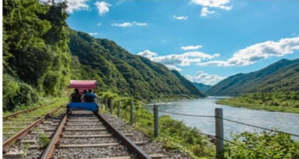
( Rail Bike )