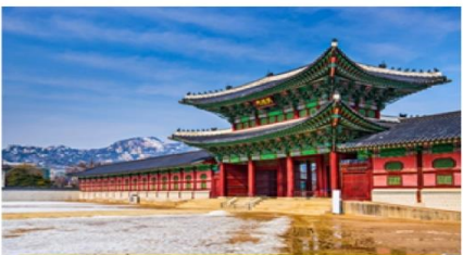
พระราชวังชางดีอกุง