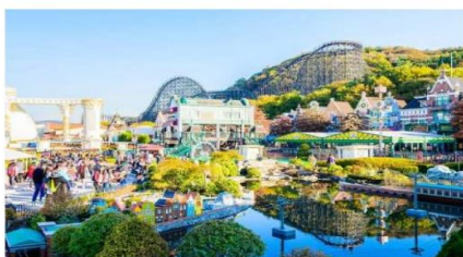
สวนสนุกเอเวอร์แลนด์