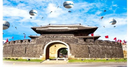
ชินบอลลูน