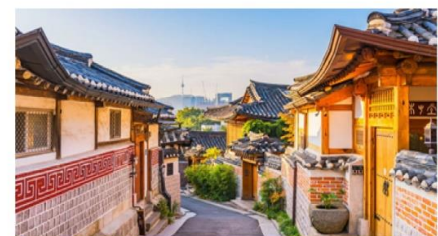
หมู่บ้านโบราณฮุกซอน