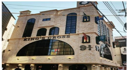
คาเฟ่แฮร์ฟोटเตอร์