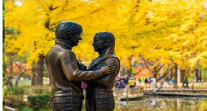
เกาะนามิ