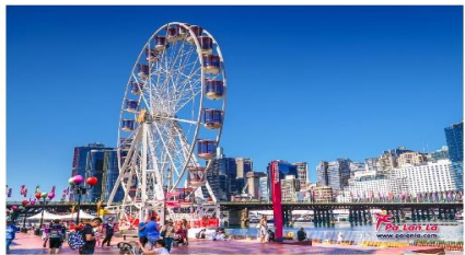
คาร์ลิ่งฮาร์เบอร์