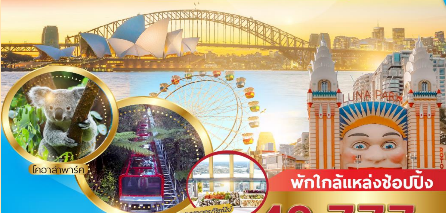
โคอาล่าพาร์ค

เช็किन สวนสนุกผู้นำ พาร์ค ล่องเรืออ่าวซิดนีย์