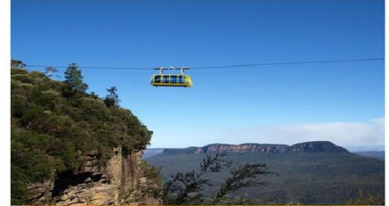
ขึ้นกระเช้าลอยฟ้า