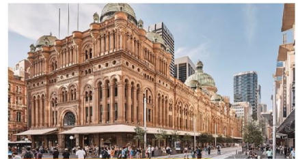
ควีนวิกตอเรียบลดิง