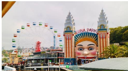
สวนสนุกภูเขา พาร์ค ซิตี้