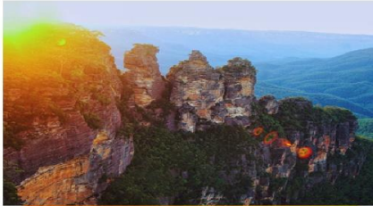
หุบเขาสีน้ำเงิน