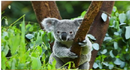
โคาล่าปาร์ค