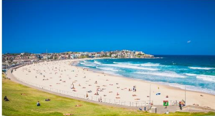
หาดบอนได