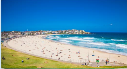
หาดบอนดี