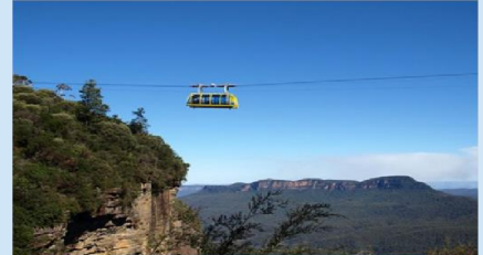
ขึ้นกระเช้าลอยฟ้า