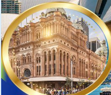
ควีนวิกตอเรียบิลดิ้ง

เซ็คอิน ย่านเดอะริอ็อคส์ ล่องเรืออ่าวซิดนีย์