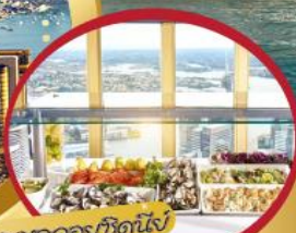
ร้านอาหารซิดนีย์ บุฟเฟ่ต์อาหารนานาชาติ