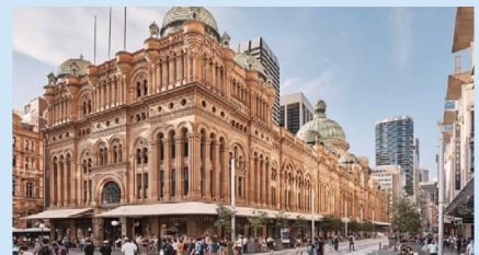
ควีนวิกตอเรียบิลดิ้ง