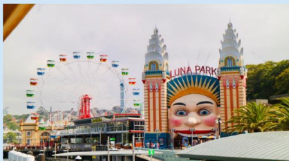
สวนสนุกลูน่า พาร์ค ซิดนีย์