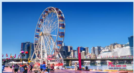
คาร์ลิ่งฮาร์เบอร์