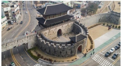
ป้อมปราการฮวาซอง