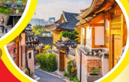
หมู่บ้านโบราณฮุกซอน