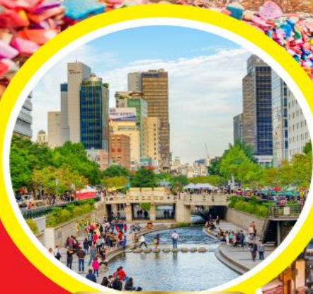
คลองชองเกซอน