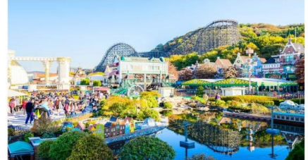
สวนสนุกเอเวอร์แลนด์