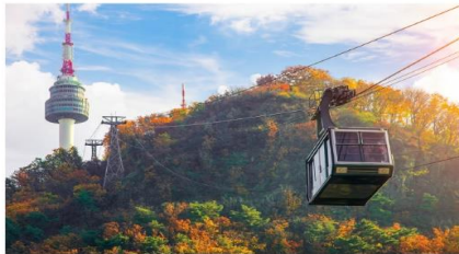
กระเช้าลอยฟ้า ณ โซลทาวเวอร์