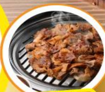
ฟินเวอร์ ๆ