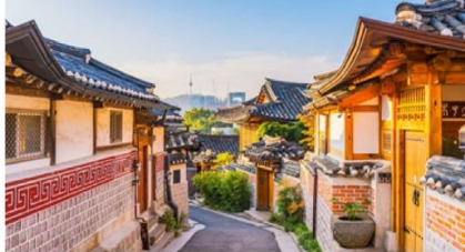
หมู่บ้านโบราณฮุกซอน