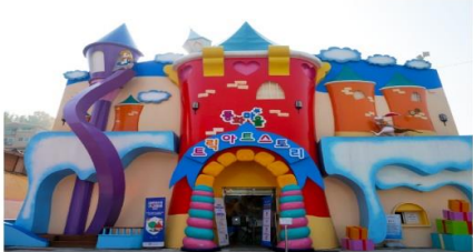
หมู่บ้านเทพนิยายซอโกลดง