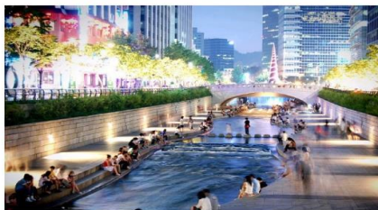
คลองชองเกซอน