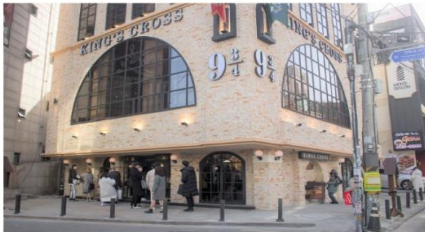
คาเฟ่แอร์รี่ พอตเตอร์