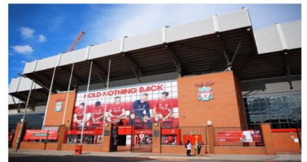
สนามแอนฟิลด์