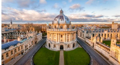
อ็อกฟอร์ด