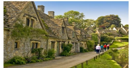
หมู่บ้านโบนิวรี่