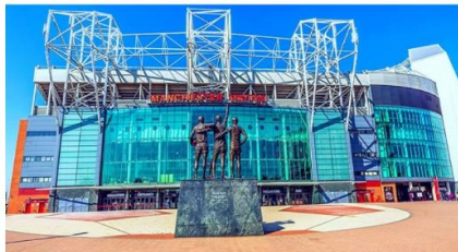
สนามโอลด์แทรฟฟอร์ด