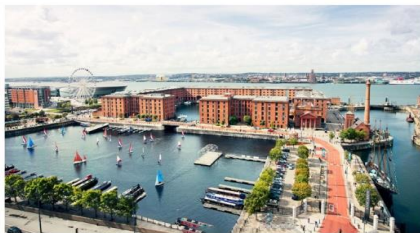
ลิเวอร์พูล