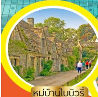
หมู่บ้านไบบิวรี่