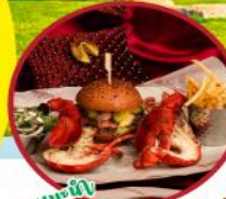
บุฟเฟ่ต์ ปอร์เตอร์&ล็อบสเตอร์