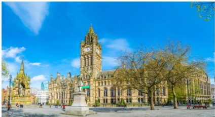
แมนเชสเตอร์