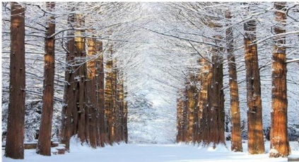
เกาะนามิ