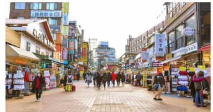
ย่านชองแด