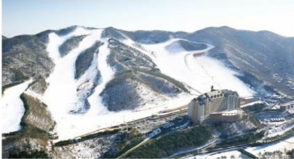
กิจกรรมลานสกี