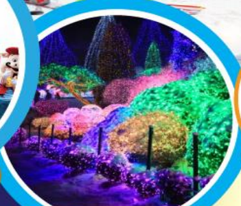
ชมเทศกาลประดับไฟฤดูหนาว