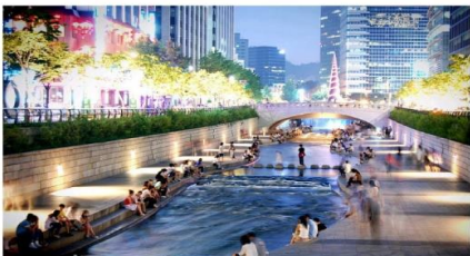
คลองชองเกซอน