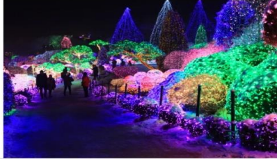
ชมเทศกาลประดับไฟฤดูหนาว