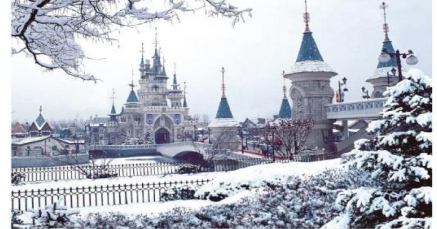
สวนสนุกล็อตเต้เวิลด์