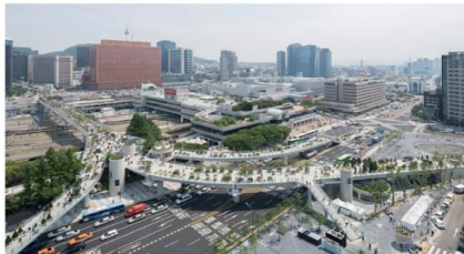
ทางเดินลอยฟ้า