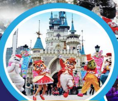
สวนสนุกล็อตเต้เวิลด์