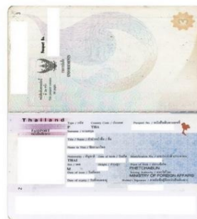
หมายเหตุ : สแกนสีเท่านั้น