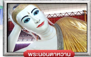
พระนอนตาหวาน

เมนู สุดพิเศษ | กุ้งแม่น้ำเผา + เปิดปึกกึ่ง + สลัดกุ้งมังกร