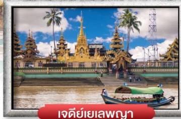
เจดีย์เยลพญา