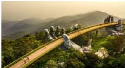
สะพานลอยฟ้า Golden Bridge