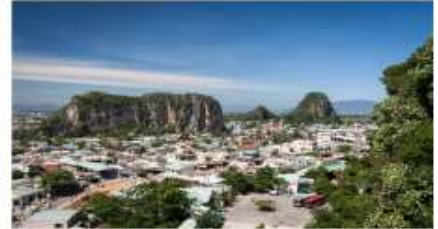
หมู่บ้านเกาะสลักหินอ่อน