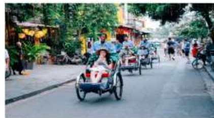
นั่งสามล้อชมเมืองฮอยอัน