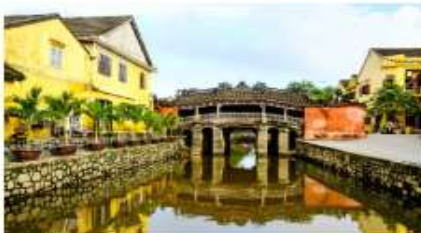
ฮอยอัน เมืองมรดกโลก