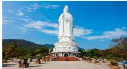
วัดหลินอิ่ง