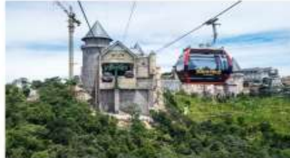
ขึ้นกระเช้าลอยฟ้า