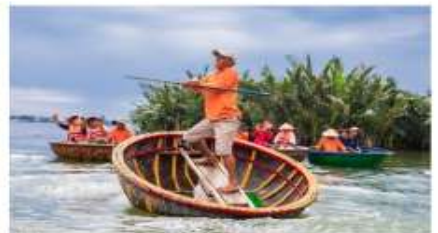
นั่งเรือกระด้ง