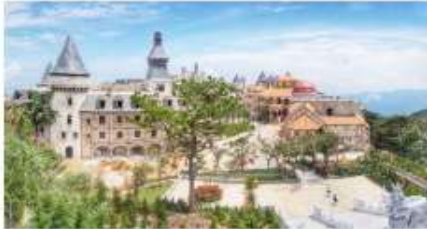
หมู่บ้านฝรั่งเศส