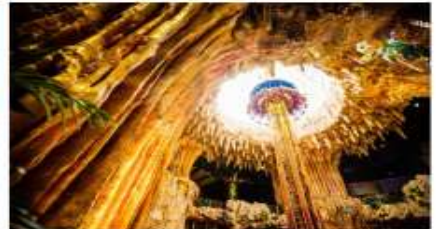
สวนสนุกแฟนตาซีพาร์ค