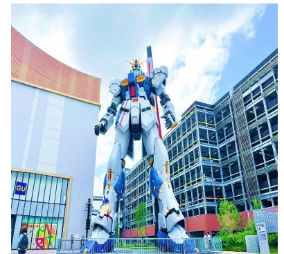
หุ่นกันดั้ม รุ่นใหม่ชื่อ RX93 FF Nu Gundam

เดินทางต่อไปยัง ฟูกูโอกะ และ แวะรูปกับหุ่นกันดั้มยักษ์ตัวใหม่ล่าสุด (เม.ย. 22) ณ ห้าง LaLaport มีขนาดใหญ่กว่า Unicorn Gundam ที่โตเกียวและใหญ่กว่า RX93 FF Gundam ที่ Gundam Factory Yokohama เรียกได้ว่าเป็นแลนด์มาร์คสำคัญของเมืองฟูกูโอกะในปัจจุบัน ... จากนั้นอิสระให้ท่านช้อปปิ้ง ย่านเท็นจิน (Tenjin) เป็นย่านช้อปปิ้งขนาดใหญ่ใจกลางเมือง รวบรวมแหล่งบันเทิง อย่างครบครัน ไม่ว่าจะเป็นตึกต้นไม้ ร้านค้าที่น่าสนใจ และบรรยากาศสุดคลาสสิก หรือจะเป็นย่านของกินอร่อยๆ อย่างย่านยะไต (Yatai) หมายถึงซุ้มขายอาหารที่มีขนาดไม่ใหญ่มาก ที่รวมร้านอาหารแบบฉบับท้องถิ่นเอาไว้มากมาย