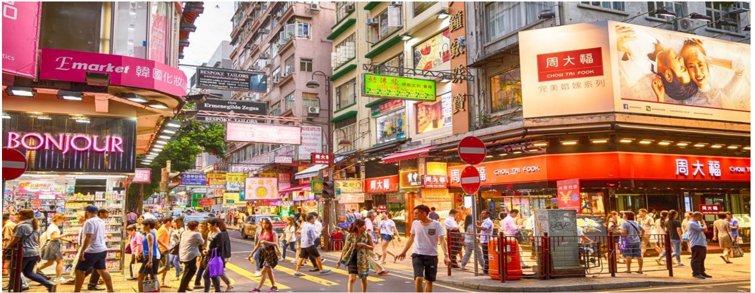
พักที่โรงแรม PRUDENTIAL HOTEL HONG KONG ระดับ 4 ดาว หรือเทียบเท่า

คำ รับประทานอาหารค่ำ ณ ภัตตาคาร จากนั้น นำท่านอิสระในการช้อปปิ้งตามอัธยาศัย บนถนนนาธาน ณ ย่านจิมซาจุ่ย ซึ่งมีร้านค้ามากมายให้ท่านได้เลือกซื้อมากมายราคาถูก เช่น GIORDANO, BOSSINI เป็นต้น เพื่อเป็นของฝากของที่ระลึก ของขวัญ หรือเลือกเดินช้อปปิ้งสินค้าห้างปลอดภาษีดีวีดีพีวี และไอเซียนเทอร์มินัลแหล่งรวมสินค้าชั้นนำชื่อดัง ที่มีร้านค้าให้ท่านเดินช้อปปิ้งกว่า 700 ร้านค้า อาทิ ARMANI, ESPRIT, EMPORIO, ARMANI, DKNY, MARK & SPENSOR และของฝากคุณหนูที่ TOY'R US หรือเดินช้อปปิ้งสินค้าบนถนนนาธาน ซึ่งเป็นแหล่งรวมเครื่องใช้ไฟฟ้า และอุปกรณ์สื่อสารที่ทันสมัย