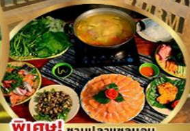
พิเศษ! ซาซูปลาแชนมอน หม้อไฟปลาสดอร์เจียน + ไวน์ดालัด