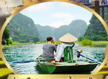
ล่องเรือกระจัดตามถ้ำตามก๊ก