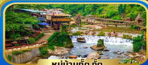
หมู่บ้านก๊ต ก๊ต

มีค็อกเทล พิกษาป่า 2 ดิน | พิเศษ! ซุฟเฟต์ 1 มื้อ