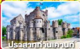
ปราสาททวินเคานท์

เบนลักซ์ กับ เมืองแปลก บารล์-นัสซา บารล์-เฮร์ตโก 8วัน 5คืน