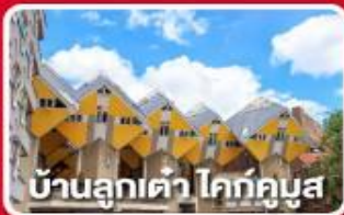
บ้านลูกเต่า โคกคูนุส