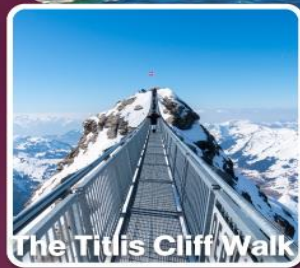
The Titlis Cliff Walk

ตามรอยซีรีส์ Crash Landing on you ที่ทะเลสาบเบรียนซ์