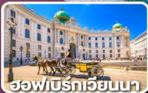
ออสเตรียเวียนนา