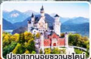
ปราสาทนอยชวานชไตน์