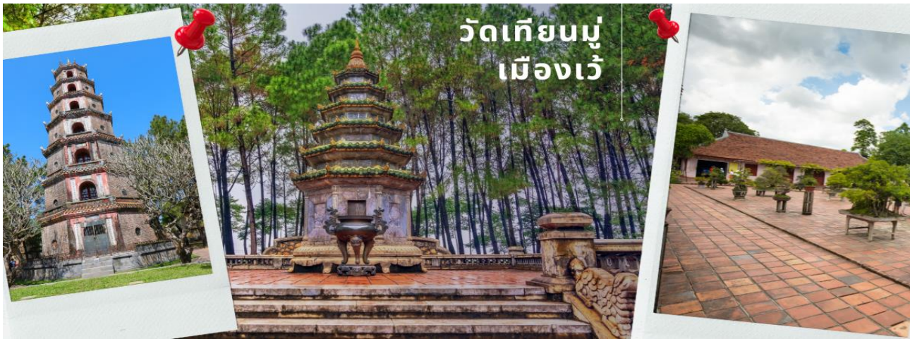
วัดเทียนมู่ เมืองเว้

บ่าย จากนั้นนำท่านเดินทางสู่เมืองเว้ (ใช้เวลาเดินทางประมาณ 2 ชม) นำท่านผ่านชม Tam Giang เป็นทะเลสาบน้ำกร่อยที่ใหญ่ที่สุดในเอเชียเป็นพื้นที่ชาวเวียดนามใช้ในการเลี้ยงกุ้ง ปลา เป็นจำนวนมาก และชมวิวที่สวยงามของอ่าวทะเล Lang Co เป็นหนึ่งในสิบอ่าวสวยงามที่สุดในโลกเป็นพื้นที่ชาวเวียดนามใช้ในการเลี้ยงหอยเพื่อการผลิตมุก จากนั้น นำท่านเข้าสู่ วัดเทียนมู่ ไหว้พระขอพรเจดีย์เทียนมู่ มีหอคอยเจดีย์ 8 เหลี่ยม สูง 8 ชั้น ซึ่งตั้งอยู่บนฝั่งซ้ายของแม่น้ำหอม พร้อมเรื่องเล่ามากมายเกี่ยวกับพระพุทธศาสนา ณ.ที่แห่งนี้ ยังเป็นที่เกิดรถออสตินส์ฟ้าคันประวัติศาสตร์ที่โลกต้องจารึกเนื่องมาจากมีพระจีนขับรถออสตินคันประวัติศาสตร์ที่ไชวอยู่ที่นี่ไปราดน้ำมันเผาตัวเองประท้วงรัฐบาลเวียดนามที่ทำลายพุทธศาสนา และเก็บภาพแห่งความประทับใจริมแม่น้ำหอม