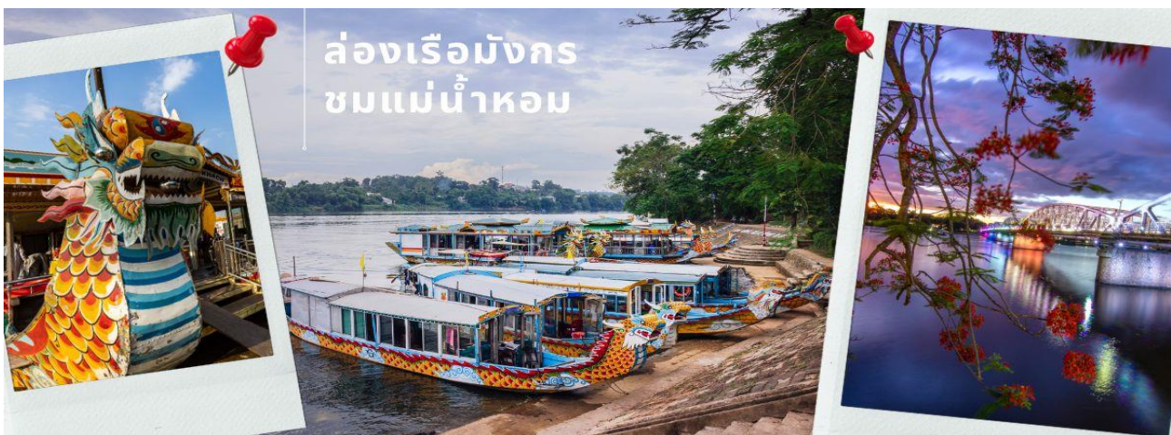
ล่องเรือมังกร ชมแม่น้ำหอม

จากนั้นนำท่าน ล่องเรือมังกรชมแม่น้ำหอม ชมการแสดงพื้นเมืองของชาวเวียดนามโบราณ ทั้งเสียงดนตรี ที่มาจากเครื่องดนตรีดีดสี่ตีเป่า และเสียงร้องขับขานในเพลงเวียดนามดั้งเดิม มันก็จะเป็นอะไรที่ถือเป็นประสบการณ์ที่ไม่รู้ลืม