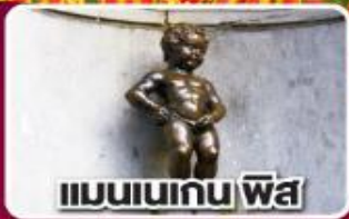
แมนเนเกน ฟิส