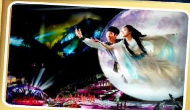
โชว์จิ้งจอกขาว