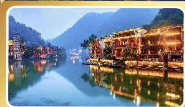
เมืองโบราณฟังหวง