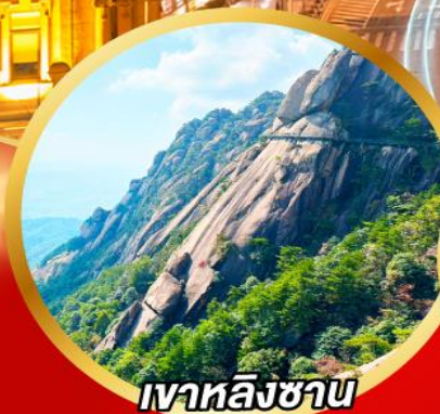
เงาหลิงซาน