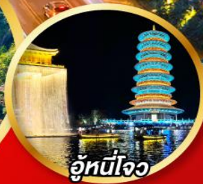
อู่หนี่โจว