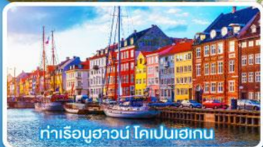
ท่าเรือฮาวน์ โคเปนเฮเกน