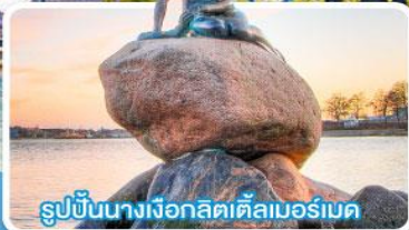
รูปปั้นนางเงือกลิตเติ้ลสอร์เบค