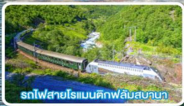
รถไฟสายโรเมนติกฟลัมสบานา