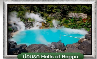
บ่อนรก Hells of Beppu