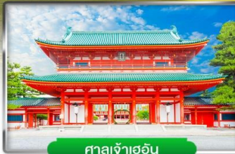
ศาลเจ้าเฮอัน