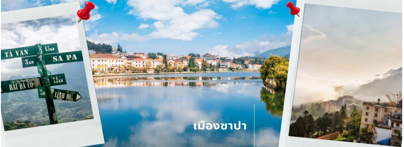
เมืองซาปา

14.20 น. เดินทางถึง สนามบินसानออย หลังผ่านการตรวจคนเข้าเมืองและศุลกากรแล้วนำท่านขึ้นรถบัสปรับอากาศ นำท่านเดินทางขึ้นเหนือมุ่งหน้าสู่ เมืองซาปา ซึ่งตั้งอยู่ทางภาคเหนือของประเทศเวียดนามใกล้กับชายแดน จีน อยู่ในเขตจังหวัดลาวไก ตัวเมืองตั้งอยู่บนระดับความสูงกว่าระดับน้ำทะเลถึง 1,650 เมตร จึงมีอากาศหนาวเย็นตลอดปี ที่นี่จึงเป็นแหล่งปลูกผักและผลไม้เมืองหนาวที่สำคัญของเวียดนาม อีกทั้งยังเป็นดินแดน