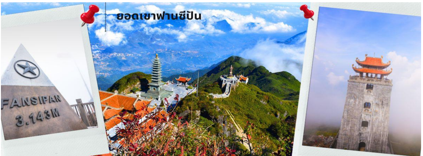
ยอดเขาฟานซีปัน

หมายเหตุ : กรณีกระเช้าฟานซีปันปิดปรับปรุงในช่วงที่ถูกค่าเดินทาง ทางผู้จัดจะเปลี่ยนรายการท่องเที่ยวไปสะพานกระจกมังกรเมมแทน