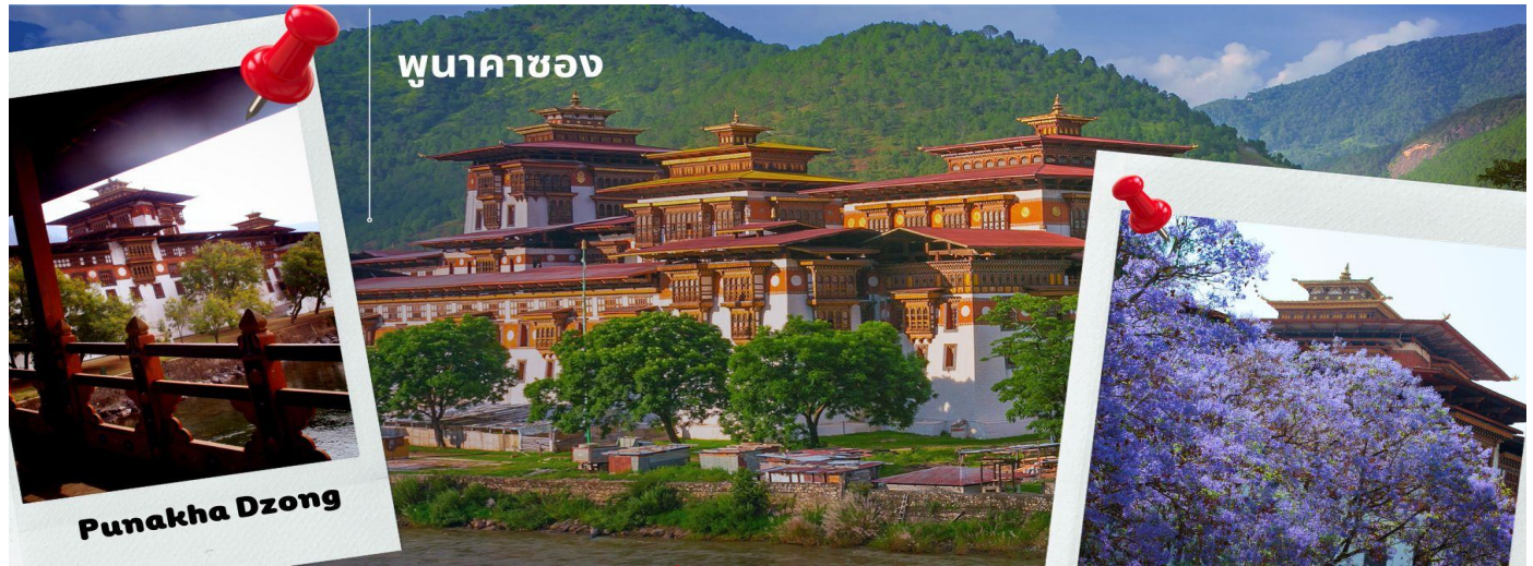
พูนาคาซอง

CB3BT1 ภูฏาน 5 วัน 4 คืน ภูฏาน แอร์ไลน์ B3 (Jun-Oct 24)