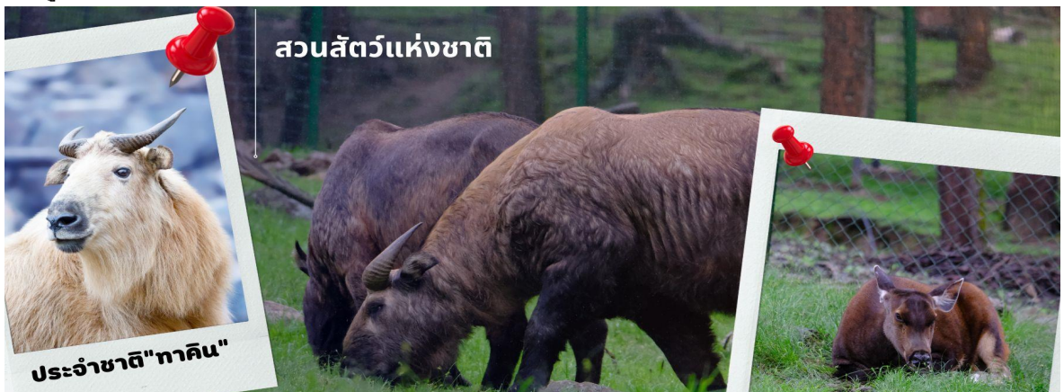
สวนสัตว์แห่งชาติ

นำท่านชม สวนสัตว์แห่งชาติของประเทศภูฏาน และชมสัตว์ประจำชาติ ทาคิน ที่มีรูปร่างลักษณะพิเศษผสมระหว่างแพะกับวัว มีแห่งเดียวในประเทศภูฏานเท่านั้น ซึ่งครั้งหนึ่งประเทศสหรัฐอเมริกาเคยเจรจาออกไปเลี้ยงแต่ได้รับการปฏิเสธจากรัฐบาลประเทศภูฏาน ทาคิน เป็นสัตว์ในตำนานประวัติศาสตร์ของศาสนาพุทธ โดยเชื่อว่าท่านลามะ Drukpa Kunley เป็นผู้สร้างขึ้นจากกระดูกของแพะและวัวที่ท่านได้ทานเป็นอาหาร กองกระดูกก็กลับมามีชีวิตอีกครั้งกลายเป็น ตัวทาคิน ที่มีลักษณะคล้ายกับแพะและวัวผสมกัน