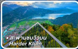
• สะพานชมวิวยอบน Harder Klamm