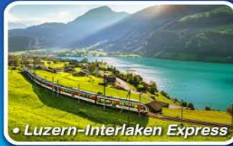
• Luzern-Interlaken Express