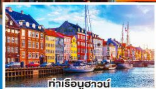
ท่าเรือบูฮาวน์

ล่องเรือสำราญสุดหรู DFDS พร้อมห้องพักแบบ Sea View