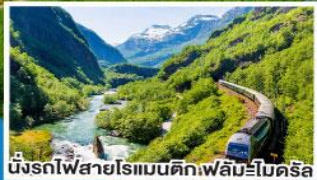
นั่งรถไฟสายโรแมนติกเฟลิมส์โมเดรัล