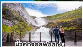
น้ำตกจอสฟอสเซน