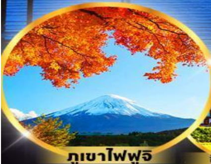
ภูเขาไฟฟูจิ