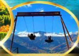
Yoo hoo! Swing