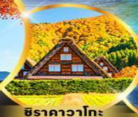
ชิราคาวาโกะ