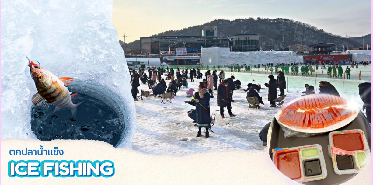
ตกปลาน้ำแข็ง ICEFISHING

(**รวมอุปกรณ์ตกปลาแบบเบสิค**) วิธีการตกปลา คือ หย่อนเหยื่อปลอม (ที่ทางเทศกาลเตรียมไว้ให้) ลงไปในรู จากนั้นก็กระตุกไม้เบ็ดตกปลาเบาๆ ให้เหมือนเหยื่อกำลังลอยไปลอยมาในน้ำ และปลาก็จะเข้ามากินเหยื่อ ง่ายๆเพียงแค่นี้ก็ทำให้ท่านตกปลาได้อย่างสนุกสนาน )