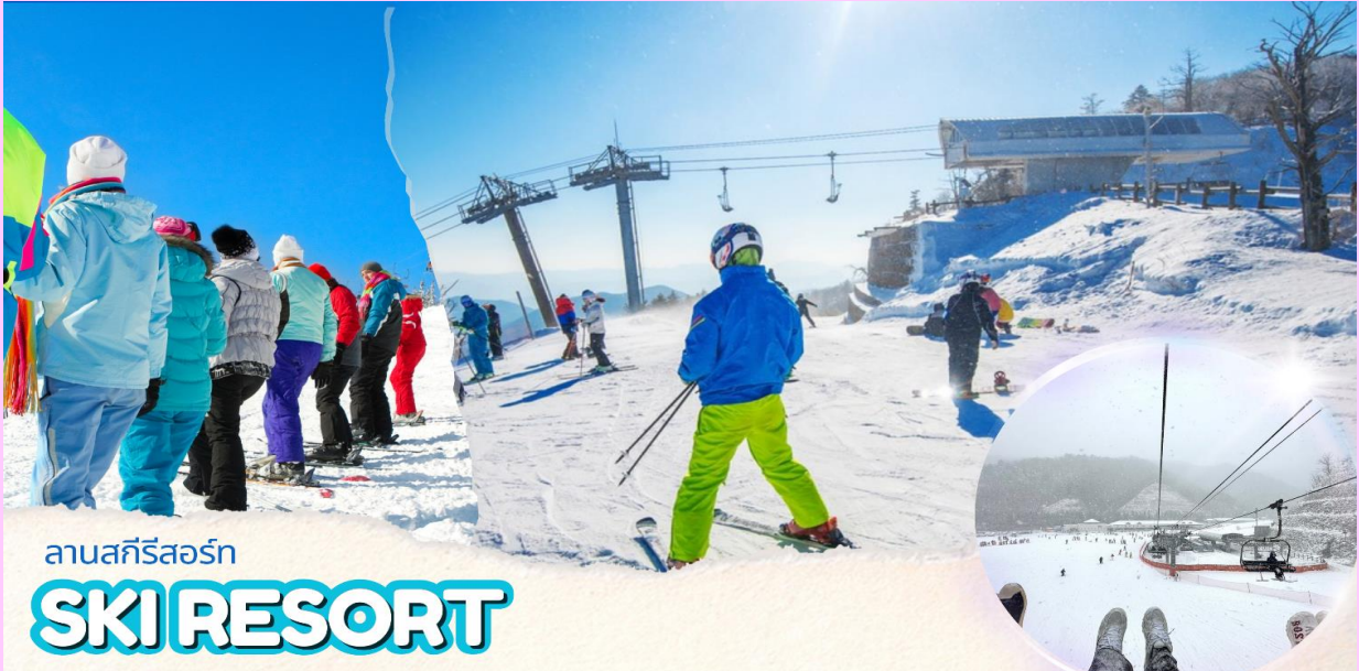
ลานสกีรีสอร์ท SKI RESORT

(ราคาทัวร์ยังไม่รวมค่าอุปกรณ์การเล่นสกี, สกิลิฟท์, สโนว์สเลด กอนโดล่า หรือ เคเบิล **ขึ้นอยู่กับสถานที่ว่ามีให้บริการหรือไม่** ) มีเวลาให้ท่านได้สนุกกับการเล่นสกีอย่างเต็มที่ ซึ่งปลอดภัยไม่มีอันตราย เตรียมตัวก่อนเล่นสกี ควรเตรียม ถุงมือสกี ผ้าพันคอ แว่นกันแดด เลือแจ็คเก็ตกันน้ำ หรือผ้าร่ม และกางเกงรัดรูป ขอคำแนะนำและฝึกวิธีการเล่นจากไกด์ท้องถิ่นก่อนลงสนามจริง เพื่อความปลอดภัยของท่านเองเป็นสิ่งสำคัญ ***ปริมาณของหิมะและการเปิดให้บริการของลานสกีขึ้นอยู่กับความเอื้ออำนวยของอากาศ***