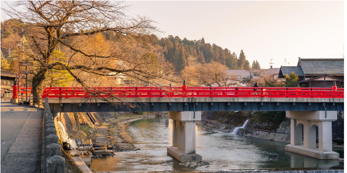
สะพานนากะบาชิ (Nakabashi Bridge) สะพานสีแดง ของย่านเมืองเก่า สะพานทอดข้ามแม่น้ำมิกายากา วะที่ไหลผ่านใจกลางเมือง สะพานแห่งนี้ถือเป็นสัญลักษณ์ของเมืองทาคายามา